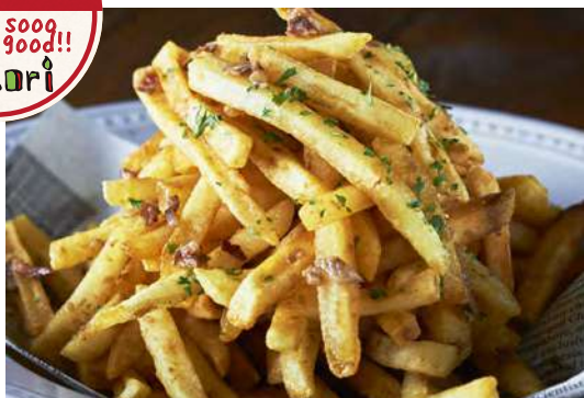
アンチョビポテト