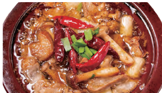
ホルモンチリージョ