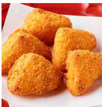
カマンベール チーズフライ