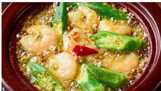
エビとオクラのアヒージョ