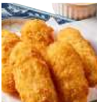
ササミチーズ ナゲット